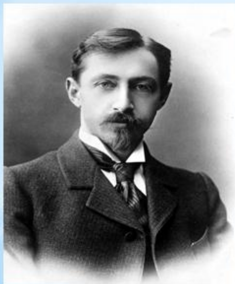
Иван Алексеевич Бунин 1870 - 1953

Иван Бунин родился 10 (22) октября 1870 года в старинной дворянской семье в Воронеже, где прожил первые три года своей жизни. В дальнейшем семья переехала в имение Озёрки (Орловская губерния). Детство его прошло именно в этом месте, среди природной красоты полей. Начальное образование Бунин получил дома.