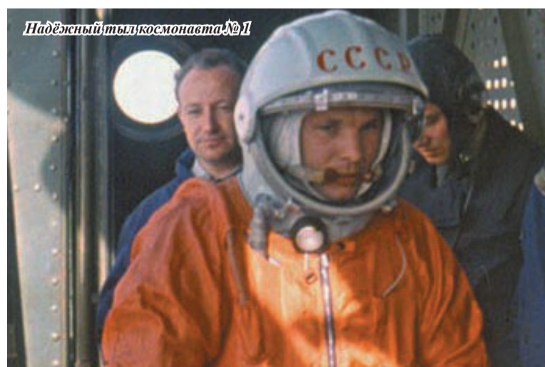
Надёжный тыл космонавта №1